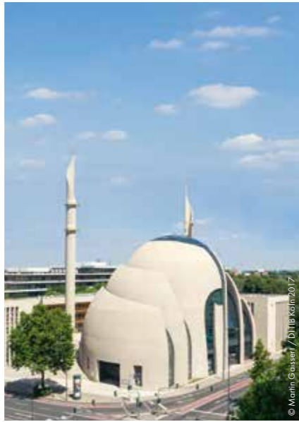
© Mimarlık / DİTİB Köln 2017

Yeni Köln Merkez Camii iç ve dış mimarisiyle gelenekten modern zamana doğru giden bir gelişmenin eseridir.